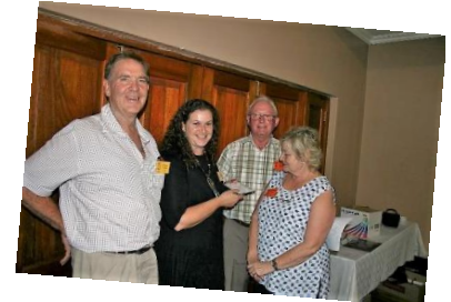
Ernstige bespreking, Vaaldriehoek was daar en die Begraafplaas DVD Serious discussion, Vaaldriehoek attended and The Cemetery DVD