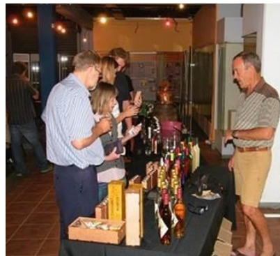
Vrydagaand se mampoerfees/Mampoer Fest Friday evening