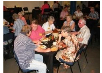
Tyd vir eet, en die kos was lekker/Time to eat, food for kings