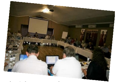
Sommer uit die staanspoor gewerk/At work right from the word go